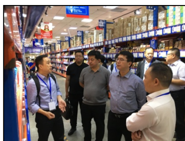
考察对俄跨境商品一站式采购平台

香洲区与爱辉区开展定向经贸对接活动，先后考察了瑗瑋山珍生物科技有限公司、瑗瑋“互联网+”产业园区、外四道沟村康养小镇以及鄂伦春民族旅游开发区等项目。随团的香洲区旅游、商贸及电商企业负责人与对口项目负责人深入交流，探讨投资合作的可能性。