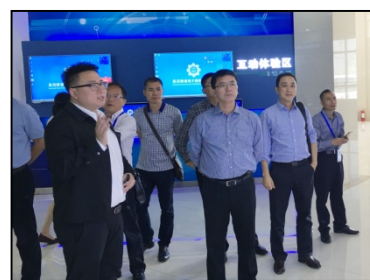
考察跨境电子商务产业园区