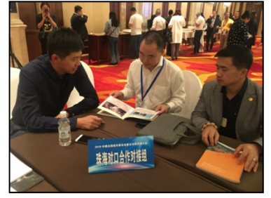
珠海企业对口洽谈合作

此次经贸交流活动内容丰富注重实效，积极贯彻落实两省共同签署《黑龙江省与广东省对口合作框架协议（2017-2020年）》以及两省有关部门、结对地市合作协议，为进一步加深两地间交往，促进双方产业、贸易、投资等领域交流与合作添砖加瓦。